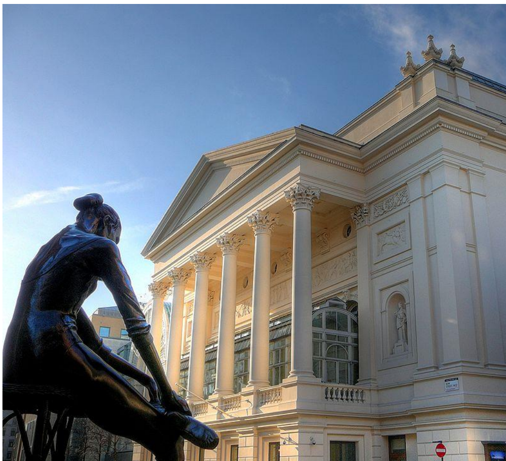
A londoni Covent Garden Operaház homlokzata