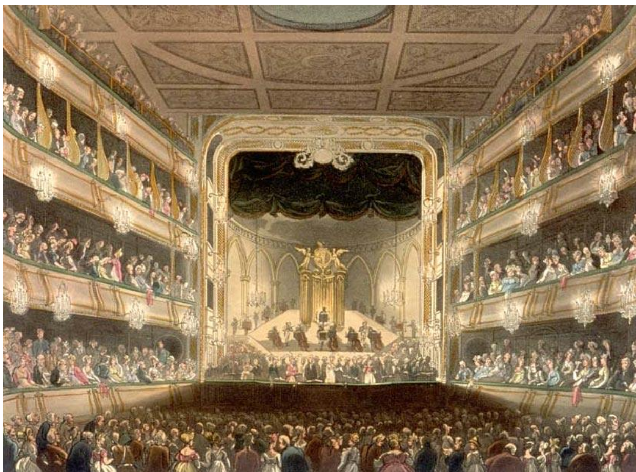
A londoni Covent Garden Operaház nézőtere 1808-ban